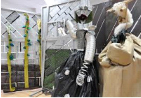
Slika 2. Lutke izrađene za lutkarsku predstavu “Vrtna opera”